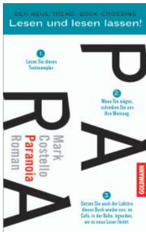
Abb. 3.02 Umschlagseite 4 des Titels „Paranoia“