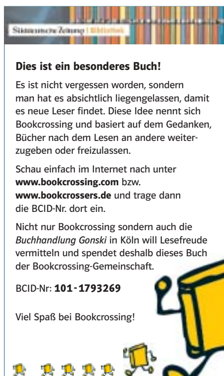
Abb. 3.04 Bookcrossing-Etikett für die Reihe der SZ-Bibliothek

Durch die Initiative von „Community-Leader“ „Wyando“ konnte ein anderer Sponsor für die SZ-Bibliothek -Reihe gefunden werden. Die Kölner Filiale der Buchhandelskette Gonski 28 erklärte sich bereit, die Gemeinschaft mit allen weiteren Bänden der SZ-Bibliothek zu beliefern. Auf diese Art und Weise konnte schließlich die Versorgung mit dieser Auswahl an Weltliteratur in der Community sichergestellt werden.